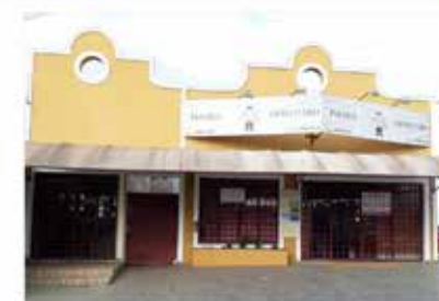
- MORADA DAS FLORES - Cod. 461/562

Mais um ano se passa e nós da Imobiliária Ravelyn somos muito felizes em participar dessa linda história de crescimento e evolução! Parabéns Holambra pelos 29 anos!