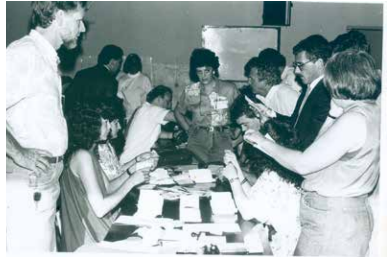
Momento da apuração de votos do plebiscito para a independência de Holambra

Rita passou a vida na cidade das flores, constituiu família e cria seus filhos aqui. Conhece a cidade tão bem que trabalha no museu, re-