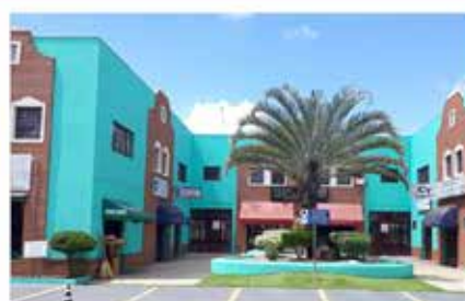
- CENTRO - Cod. 374/543