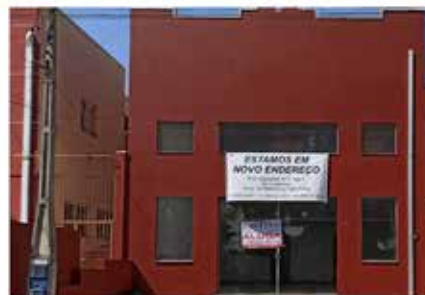
- JD DAS TULIPAS - Cod. 561