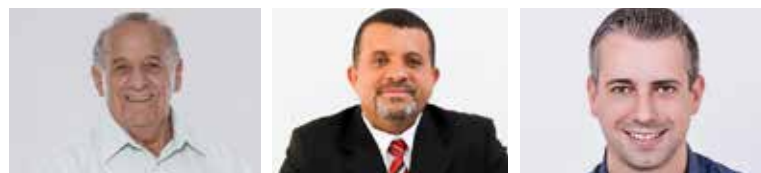
O critério usado para a ordem dos candidatos foi o envio das respostas

datos receberam um espaço livre para falar com o eleitor, além de mandar uma mensagem para Holambra, que faz aniversário no dia 27 de outubro.