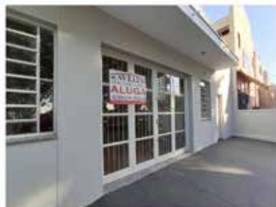
- JD DAS TULIPAS - Cod. 546