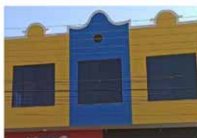
- MORADA DAS FLORES - Cod. 559