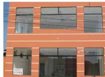
- MORADA DAS FLORES - Cod. 550