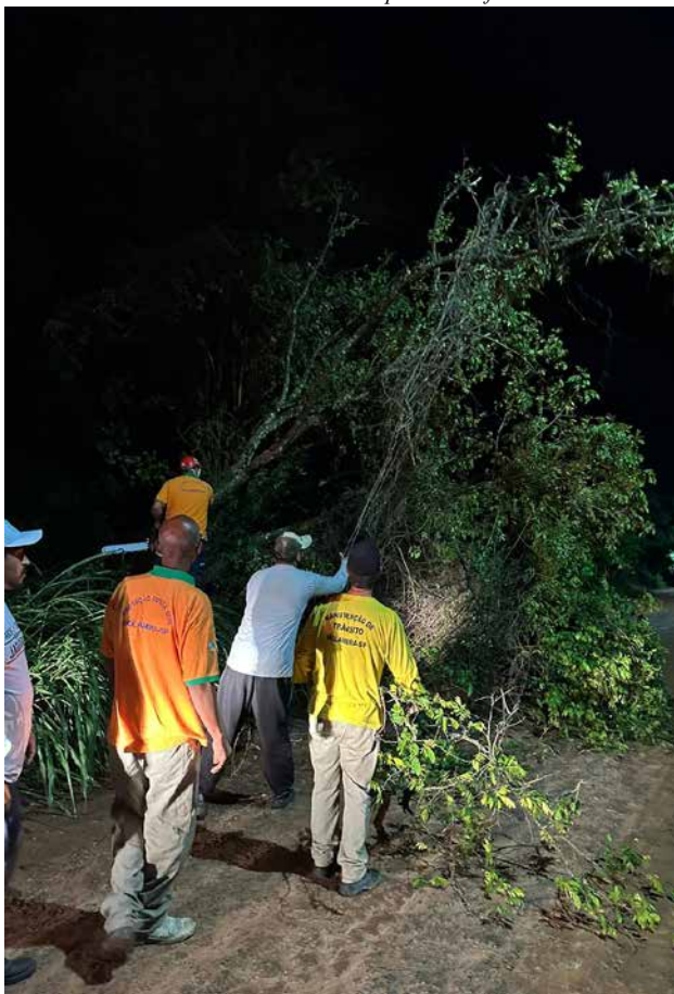
Funcionários retiram árvores caídas e liberam acessos

assessoria de imprensa Prefeitura de Holambra