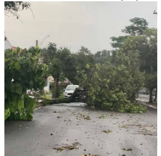
Árvore atrapalha o trânsito

que todo mundo tem de ajudar", defendeu o empresário.