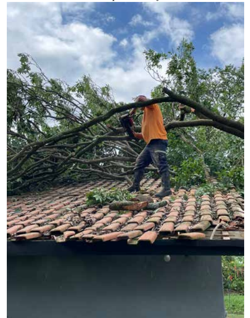
Trabalho da Defesa Civil

assessoria de imprensa Prefeitura de Holambra