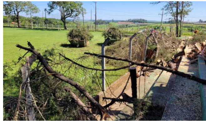
Campo do Fundão