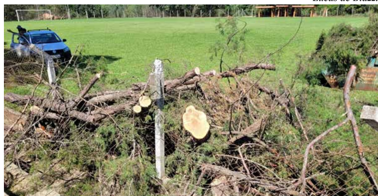
Campo do Fundão