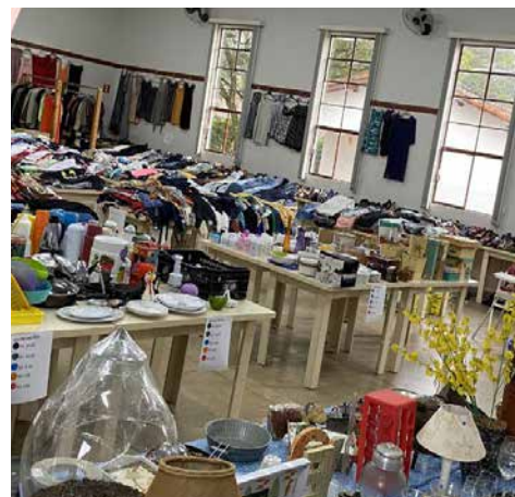
Objetos à venda em edições anteriores