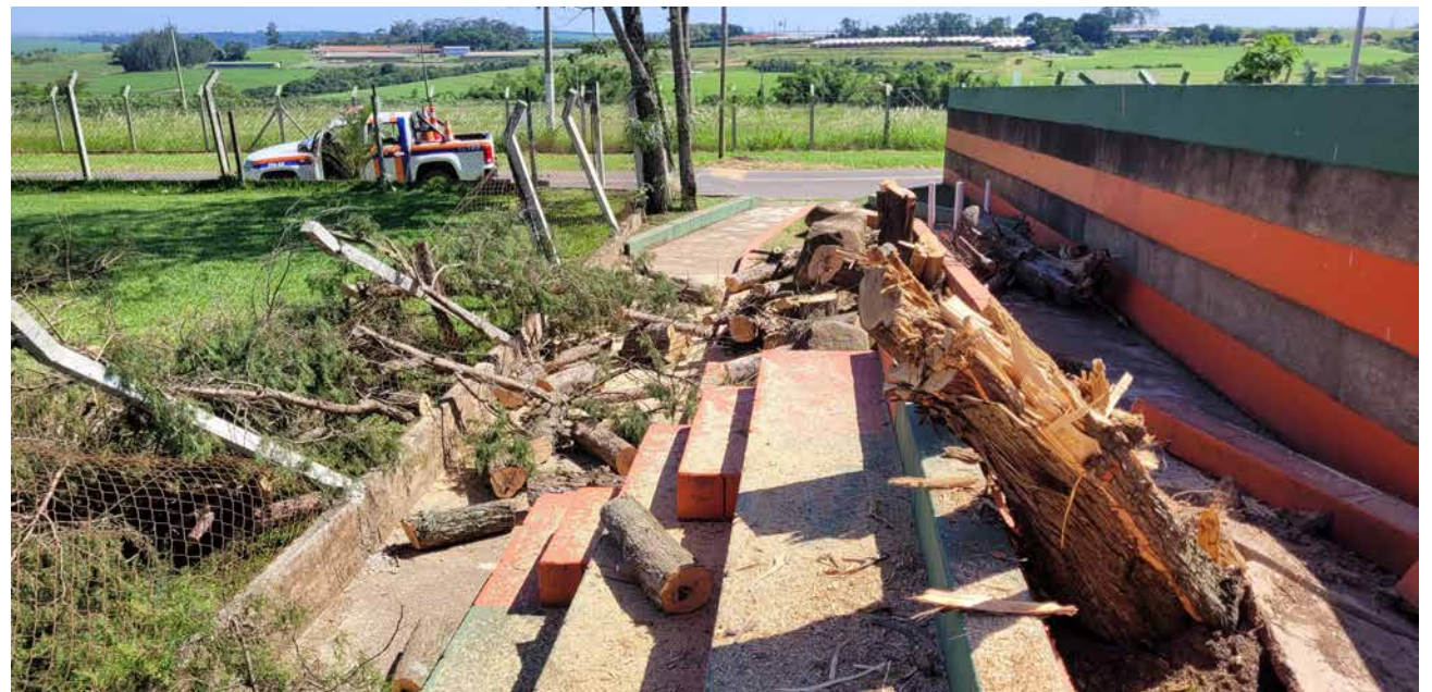
Campo do Fundão: árvores atingiram o alambrado