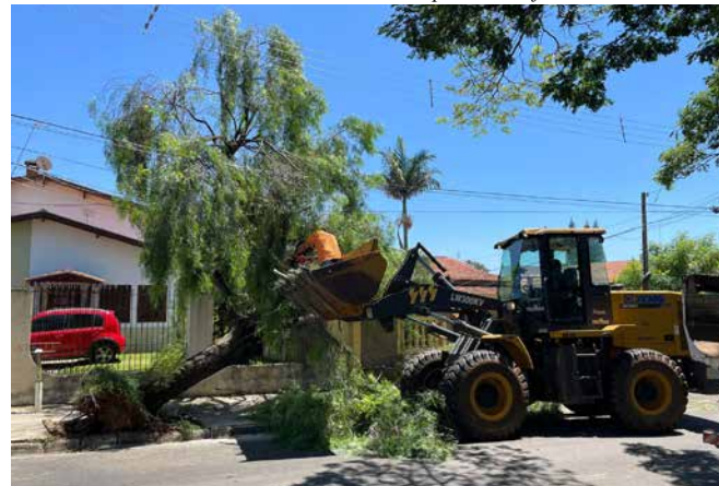
Trabalho da Defesa Civil

assessoria de imprensa Prefeitura de Holambra