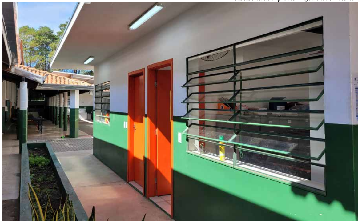
Prédio da escola Novo Florescer: pintura nova e ampliação

A Escola Municipal Novo Florescer recebe alunos do 1º ao 5º ano do Ensino Fundamental I e do Complemento Educacional.