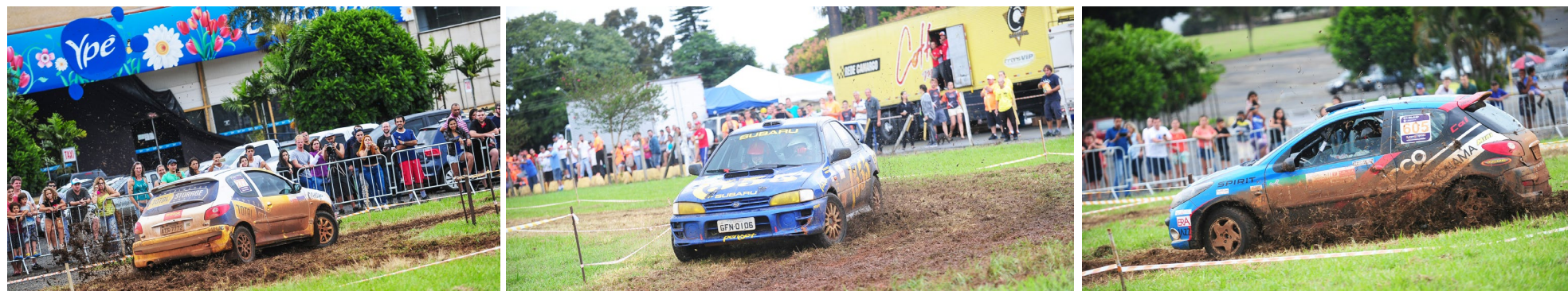
Rally de Holambra: evento contou com mais de 70 pilotos e levou centenas de pessoas ao recinto da Expoflora; holambrenses estrearam na competição e esperam nova etapa por aqui! 15