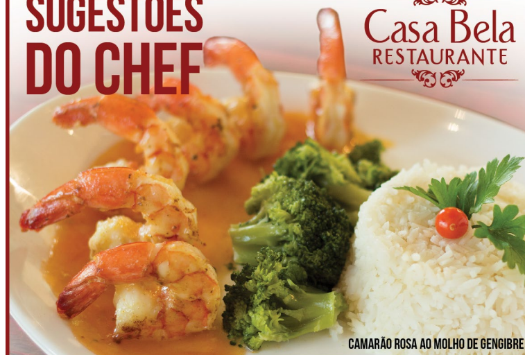
CAMARÃO ROSA AO MOLHO DE GENGIBRE

RUA DÓRIA VASCONCELOS, 81 - CENTRO - HOLAMBRA, SP