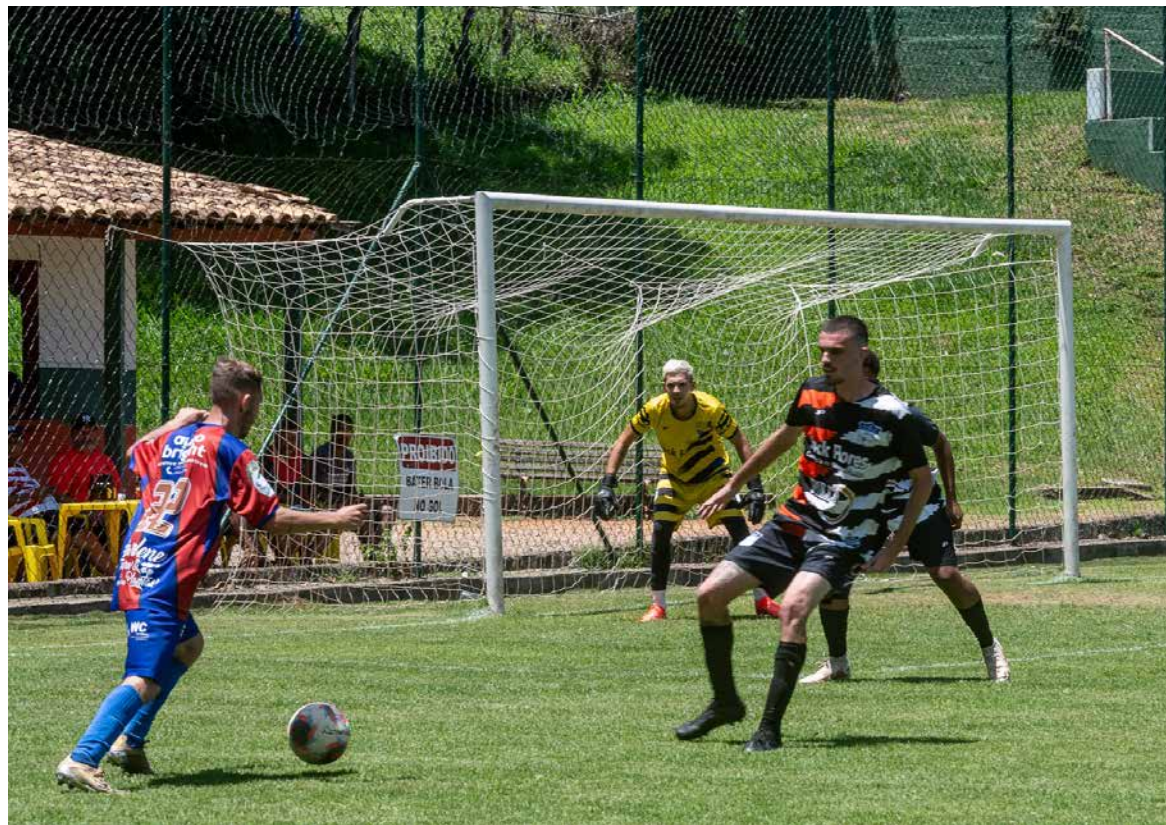
Competição tradicional, Amador começa ainda no primeiro semestre

No mês de abril será promovida a competição de futebol que envolve jogadores veteranos e, em junho, o já tradicional Campeonato de Futebol Amador.