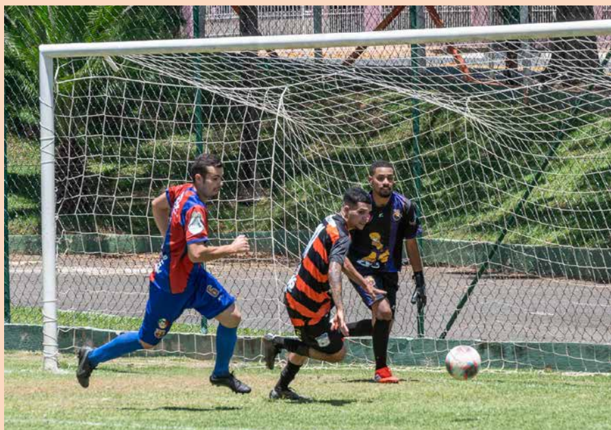
Campeonato Municipal de Futebol Amador: previsto para junho