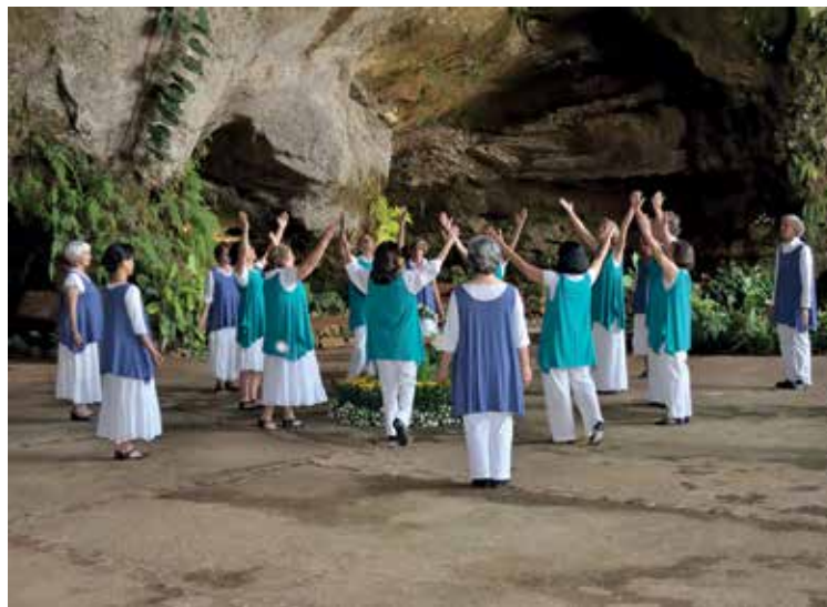
A missa acontecerá no Salão da Terceira Idade, às 10 horas

O salão está localizado à Rua das Muscárias, 99, Jardim Morada das Flores. Conforme informou o instituto, esta “missa” compreende algumas partes da liturgia católica e