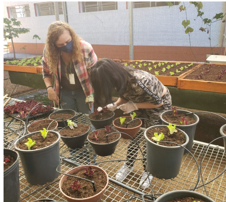
Horta no Naott: educação ambiental está entre os itens avaliados para a conquista do selo de Município Verde Azul

Verde Azul foi lançado em 2007 e avalia a eficiência da gestão ambiental nas cidades paulistas (recebem o selo aquelas que somam a partir de 80 pontos e preenchem requisitos pré-definidos para cada ciclo). O ranking foi divulgado pela primeira vez em 2011, com Holambra na 617ª posição. No ano seguinte, a cidade não pontuou. A partir de 2013, Holambra começou a avançar posições: ficou em 463ª e, em 2014, na 355ª. Recebeu a premiação referente aos anos de 2015, 2016 e 2017 e ficou fora em 2018. Com a reavaliação solicitada em março, voltou a conquistar o selo em 2019.