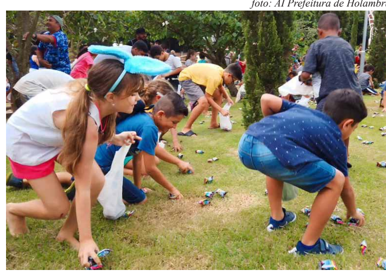
Caça aos ovinhos promete divertir a garotada