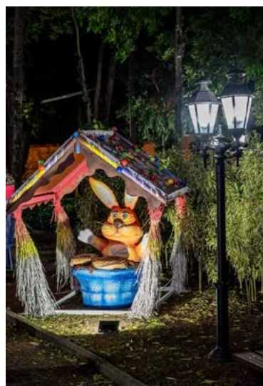
Mais um coelho na Praça