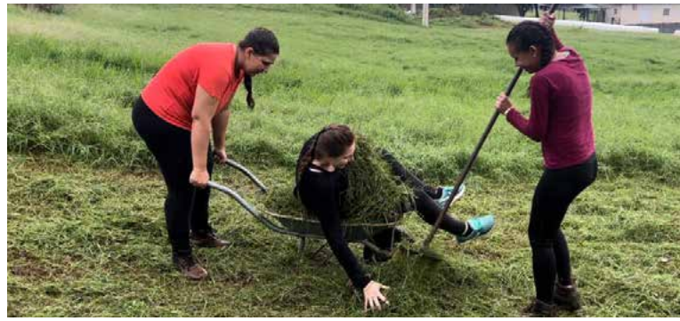
Acima, esforço e criatividade nas provas; abaixo, a equipe vencedora