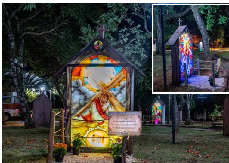
Na Praça dos Coqueiros, exposição de painéis da Via Sacra