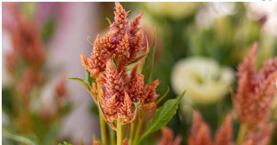
Celosia Celway Salmon, um dos lançamentos em flores desta edição

Falta apenas uma semana para o início da 40ª edição da Expoflora. O evento acontece de 25 de agosto a 24 de setembro, de sexta a domingo. Holambrenses, munidos do cartão cidadão emitido até julho, têm entrada gratuita. 8