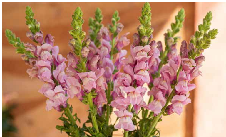
Lançamento em flores: Boca de Leão

Haverá também a tradicional Parada das Flores, espetáculo com carros alegóricos decorados por artistas florais que juntamente com o