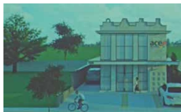
Projeto sede nova.

Ele ressalta que se sente muito honrado em estar à frente da Associação neste momento em que ela comemora três décadas. “Fico muito satisfeito em ter feito parte da primeira diretoria, e ter estado na primeira reunião em que discutimos a sua criação, e poder estar aqui agora, presidindo a Associação nessa festa de 30 anos”.