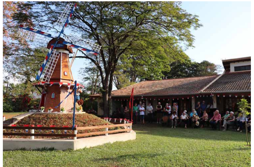
Símbolo da Instituição, Moinho foi restaurado com ajuda da comunidade. Inauguração, na última sexta, dia 11, reuniu autoridades do município e contou com a participação dos idosos da Casa Mãe e do Comdomínio. 3

Público animado e diversidade de produtos marcam 23ª edição 5