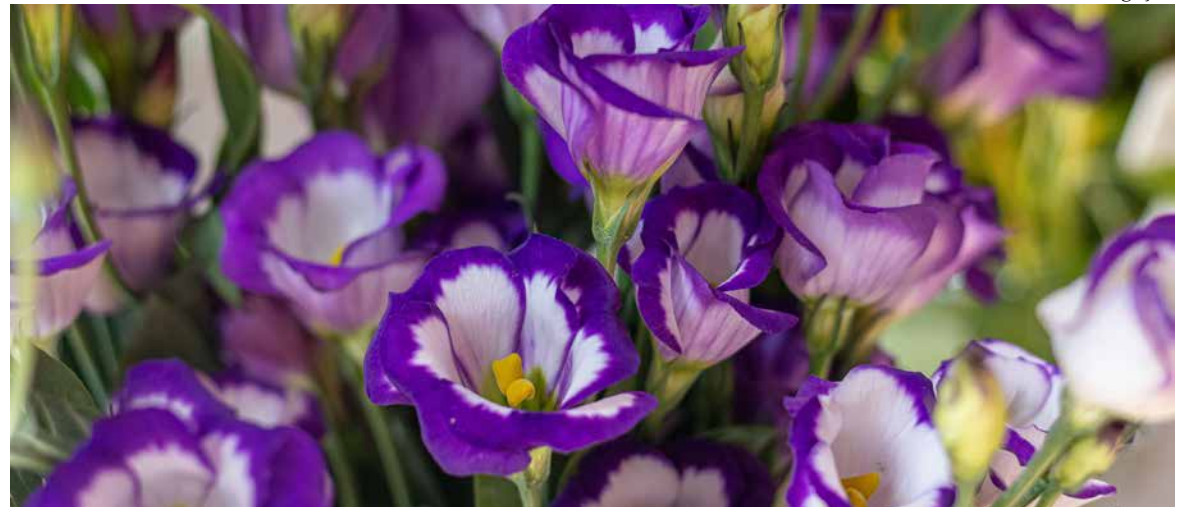
Lançamento em flores: Lisianthus solo

“Tulipo”, mascote do evento, e a nova personagem “Flora”, conduzem o público até o local onde ocorre a Chuva de Pétalas, ponto alto da festa. Realizada todos os dias de evento, por volta das 17h, a Chuva é composta por cerca de 300 mil pétalas colhidas de 18 mil botões de rosas.