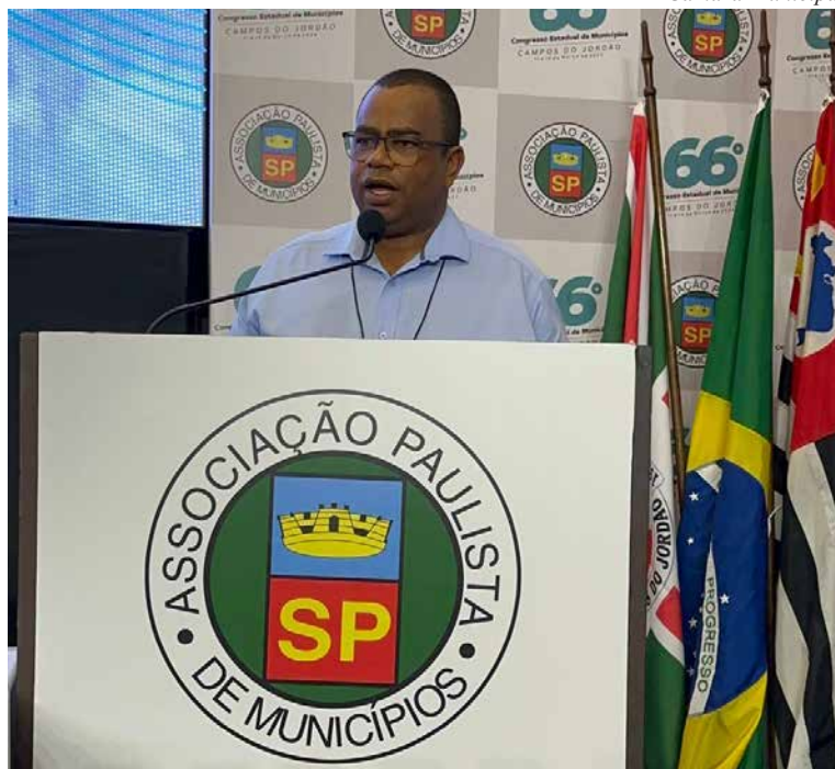
AI Câmara Municipal

Para Serjão, foi uma ótima oportunidade para buscar soluções conjuntas e conhecer os problemas de outros municípios e dar visibilidade a Holambra. "Precisamos