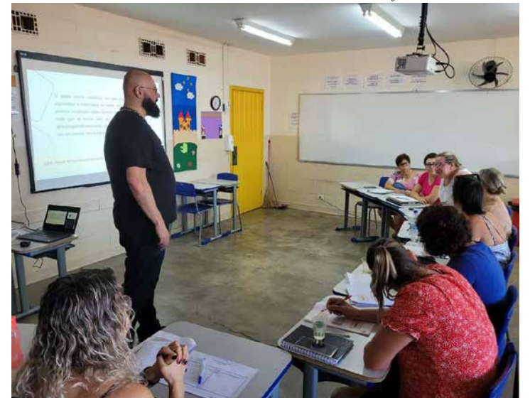
AI Prefeitura de Holambra

gógicos aos profissionais. O objetivo é apoiar as escolas no processo de desenvolvimento da escrita e da leitura das crianças, para que ocorra na fase adequada – até o final do 2º ano do Ensino Fundamental. As atividades, remotas e presenciais, seguem até o fim do ano.