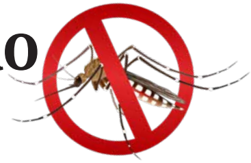
Al Prefeitura de Holambra

O departamento municipal de Saúde realiza neste sábado, dia 16, entre 8h e 12h, mais uma ação de combate ao mosquito Aedes aegypti . Os mutirões têm sido realizados todos os sábados na cidade desde o dia 20 de janeiro.