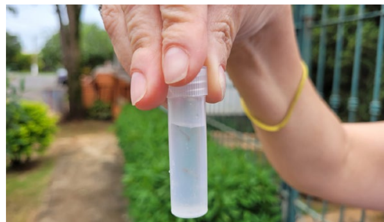
Al Prefeitura de Holambra

A orientação do departamento é que os moradores permitam a entrada dos trabalhadores. Na semana passada, o Mutirão que estava previsto para acontecer no sábado, dia 25, teve de ser cancelado em função das chuvas e nova data será marcado para a região.