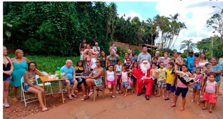
Ação social promovida pela dupla