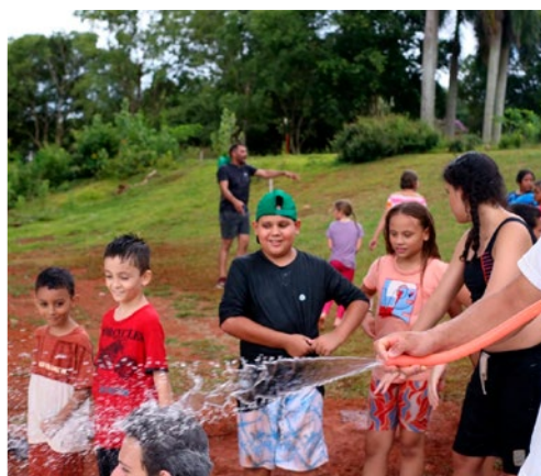
Colônia de Férias Terra Viva

Abertas as inscrições para curso de corte, costura, ajustes e reforma de roupas!