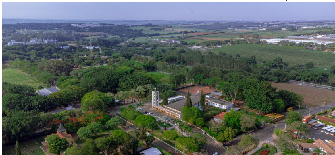
AI Prefeitura de Holambra

Quem optar pelo pagamento à vista, em cota única, terá o benefício de 10% de desconto assegurado por Lei Municipal. Se preferir, o contribuinte pode parcelar o tributo em até 10 vezes, com a última mensalidade prevista para 10 de dezembro de 2025, sem desconto.