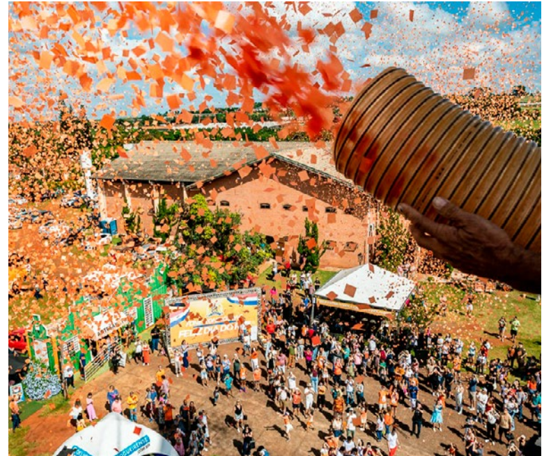
Dia do Rei: evento já é tradicional na cidade