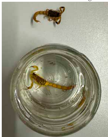
Espécie mais comum na região, escorpião amarelo ( Tityus serrulatus ) é conhecido pelo veneno potente

de casa, é importante sempre verificar cuidadosamente sapatos, roupas, toalhas e roupas de cama antes de usá-los; limpar ralos do banheiro e cozinha e caixas de gordura periodicamente; manter camas e berços afastados da parede; colocar telas nas aberturas de ralos e pias e tomar cuidado com frestas que podem servir de esconderijo para o animal peçonhento.