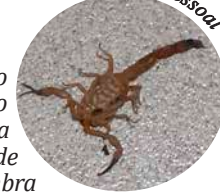
Escorpião encontrado em residência no centro de Holambra