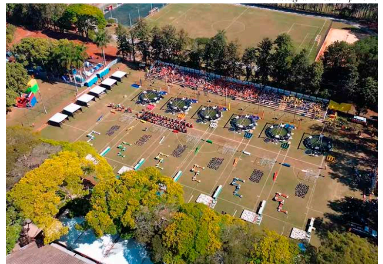
instagram Zeskamp 2024