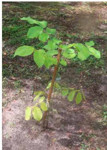
Mudas já plantadas no Bosque da Tante Ia