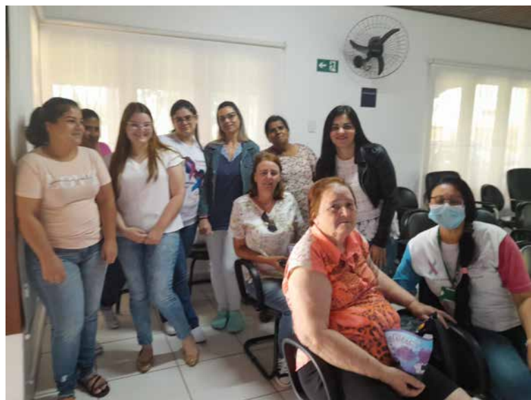
Grupo assistiu a palestra e tirou dúvidas

como uma forma de terapia e que vem apresentando vários benefícios físicos e mentais para diversos pacientes. (Lucas de Biazzi).