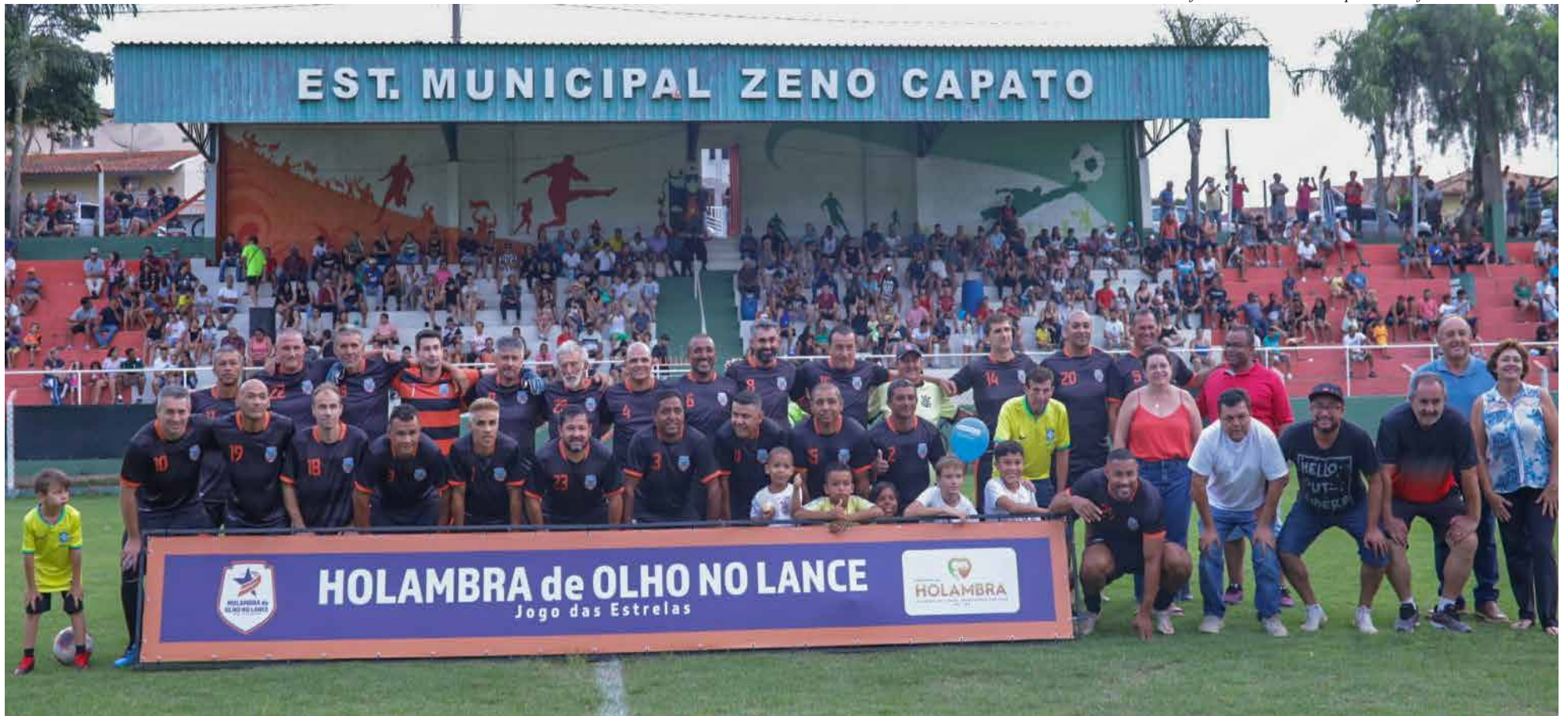
Equipe de Holambra posa com familiares e apoiadores: jogo em clima de festa