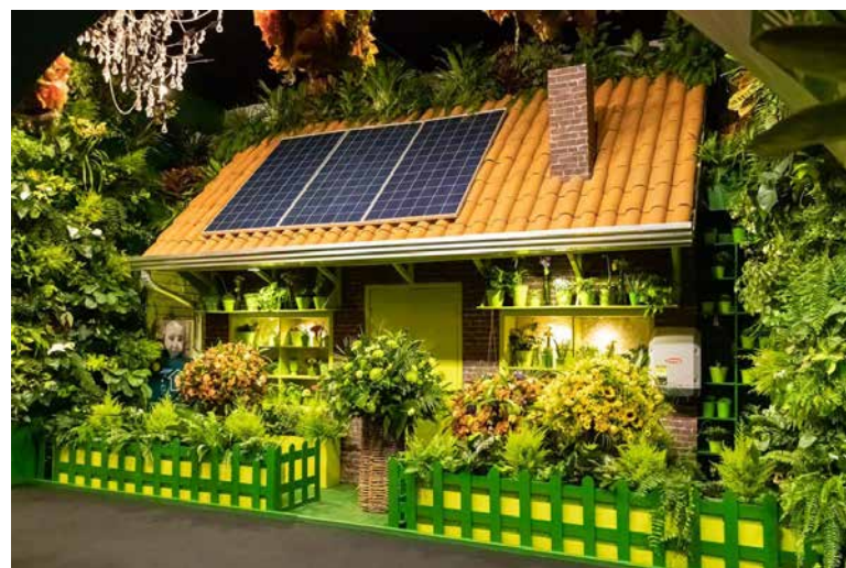
Magia e encantamento na exposição

flores, entre quatro mil variedades, como rosas, crisântemos, boca de leão, antúrio, hortênsias e muitas outras.