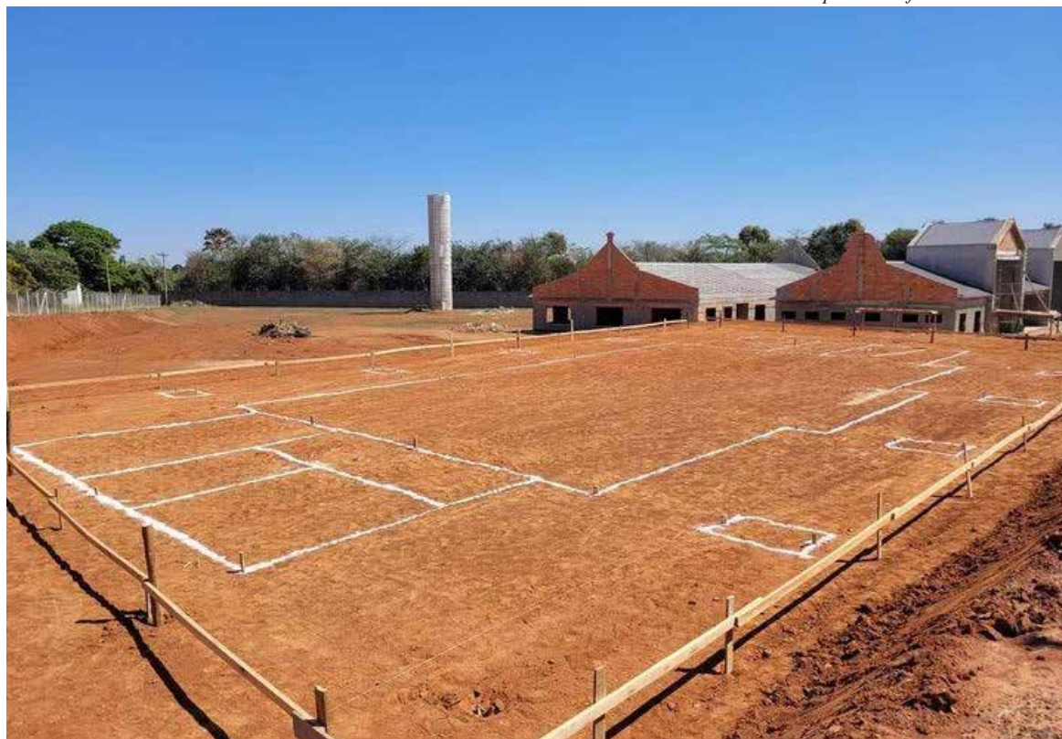
Área próxima ao Residencial Flor D'Aldeia será sede da Casa da Juventude