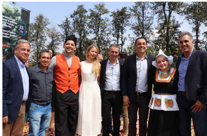
Autoridades do Estado durante a coletiva e em visita às dependências da Expoflora