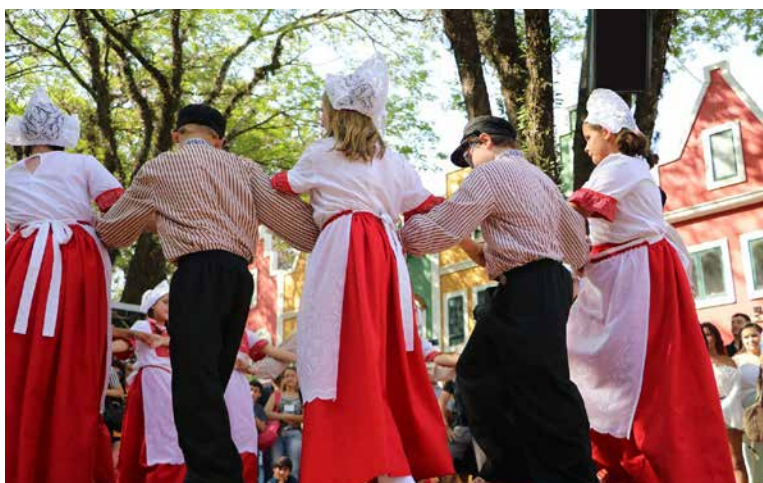
Dança típica: tradição cultural

Serão ao todo 120 expositores, distribuídos numa área total de 250 mil m 2 , com área de circulação de 108 mil m 2 . A capacidade é de 25 mil visitantes por dia e o estacionamento pode receber até 5 mil veículos.