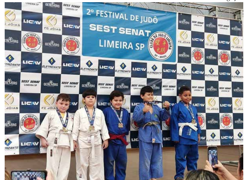
Crianças da Escolinha recebem medalha em Limeira

Alunos da escolinha de Judô da Prefeitura participaram neste fim de semana do 2º Festival Sest Senat da modalidade. O evento foi organizado pelo Clube de Judô de Limeira e reuniu 350 atletas de diversas cidades do Estado.