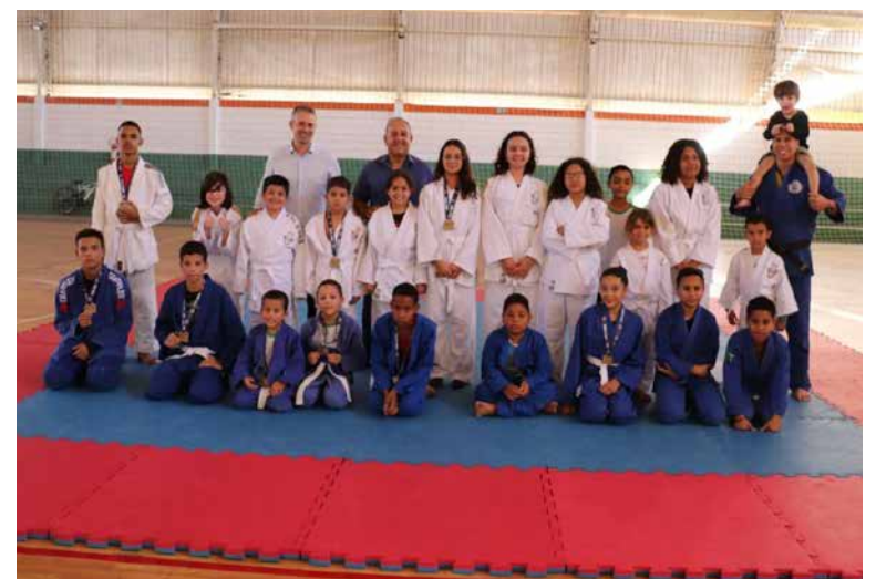
Na segunda-feira, dia 21, a Prefeitura fez a entrega dos quimonos aos alunos da escolinha

A atividade, voltada para crianças e jovens entre 4 e 16 anos, é realizada no Ginásio Municipal, às segundas, quartas e sextas-feiras, nos períodos da manhã e tarde.