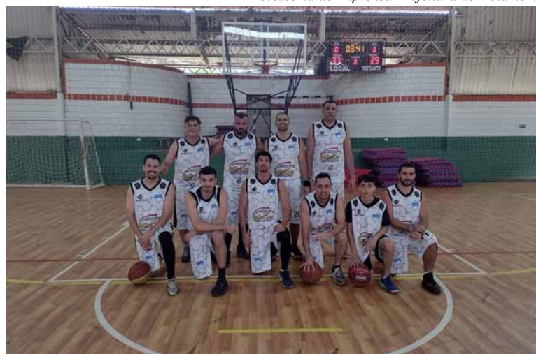
Hortocityhawks, de Hortolândia

No segundo jogo, a equipe Hortocityhawks, de Hortolândia, levou a melhor sobre Beco Pedreira, com placar de 94 a 58, na 11ª