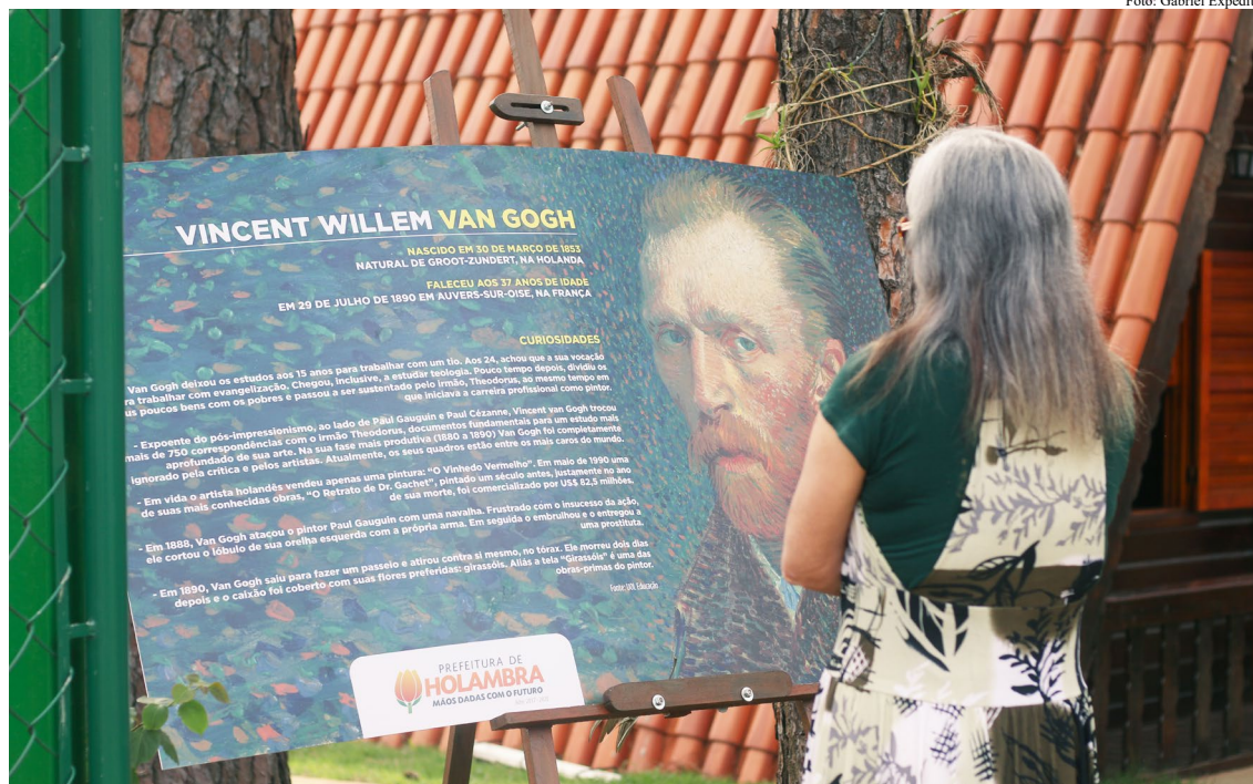
Parque Van Gogh: espaço ficará aberto aos sábados e domingos; mais duas obras serão entregues até o final deste mês