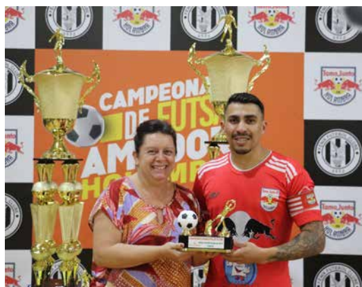
Goleiro menos vazado