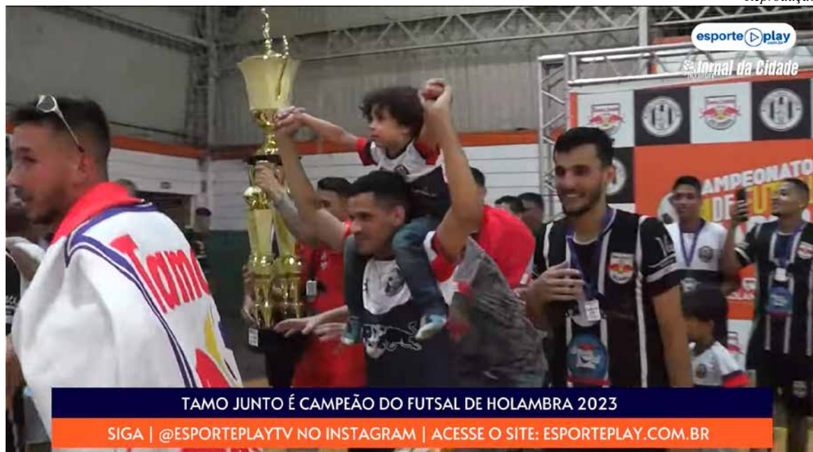
Tamo Junto: comemoração dos campeões