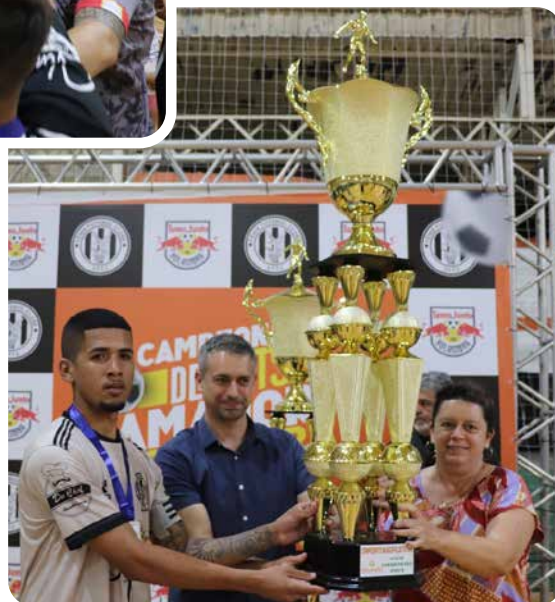
Fênix recebe troféu de vice-campeão