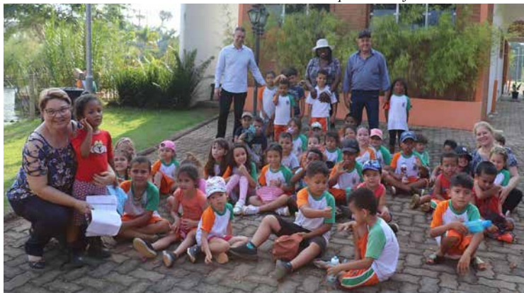
No Parque (acima) e no Trenzinho (à direita): dia de brincar e se divertir

Na terça, dia 3, o passeio e a visita dos pequenos da creche Favo de Mel, no Fundão, foi acompanhada pelo prefeito Fernando Capato e o vice Miguel Esperança.