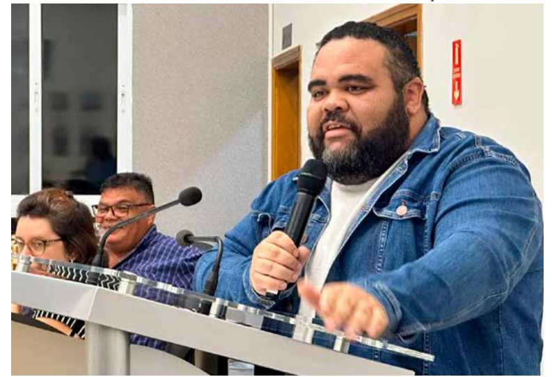
Assessoria de Imprensa da Câmara

De acordo com a justificativa do projeto, “a Semana da Educação Financeira contribuirá para a promoção da equidade social, uma vez que alunos de diferentes contextos socioeconômicos terão a oportunidade de adquirir conhecimentos que podem