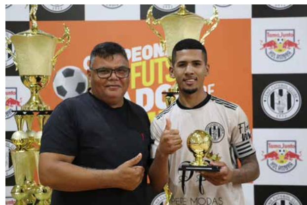
Melhor jogador da competição / Fênix