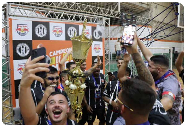
Tamo Junto: comemoração dos campeões