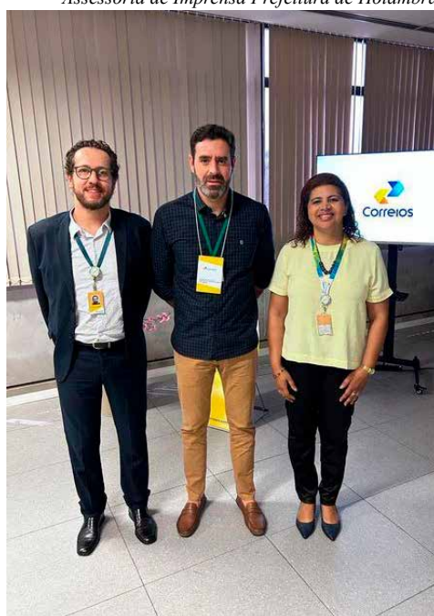
Assessoria de Imprensa Prefeitura de Holambra

Representantes do departamento de Desenvolvimento Econômico e Habitação participaram esta semana, em Indaiatuba, de reunião com a superintendência regional da Empresa Brasileira de Correios e Telégrafos. No encontro, foram discutidas as alterações promovidas a partir de agosto, com a implementação do CEP individualizado em Holambra. A mudança, solicitada em maio pela Prefeitura para garantir referência postal mais adequada, facilitando e agilizando serviços de entrega para moradores, comércios e empresas, já está em vigor.