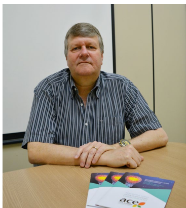
Graat: ACE investirá em campanha voltada ao consumo local e valorização do pequeno

Mas apesar das medidas e até de ações no sentido de pressionar os governos estadual e federal a socorrer com ajuda financeira o empresário e, conseqüentemente, os empregos, Graat adiantou ser impossível não prever desemprego e fechamento de negócios por dois principais fatores: queda drástica nas vendas