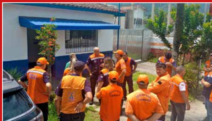
Defesa Civil Holambra presente em São Sebastião