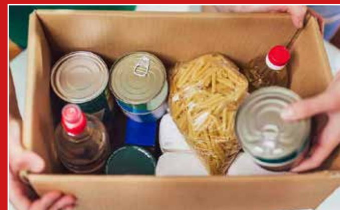
Arrecadação em Holambra