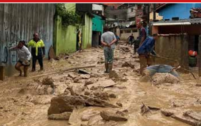
Imagem local: webb