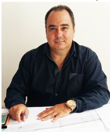
Cortez: projeto priorizou o pedestre, unindo embelezamento e praticidade

Cortez lembrou que logo após o início da remodelação na Dória Vasconcelos (a eta-