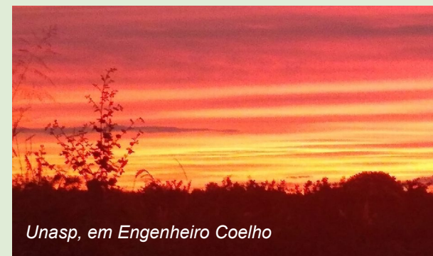
Unasp, em Engenheiro Coelho