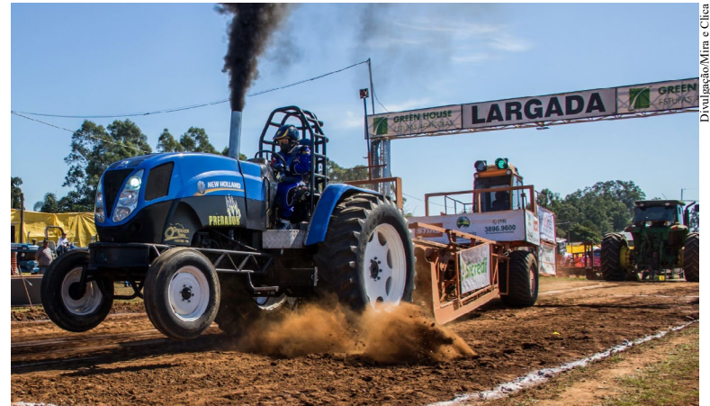
Trekker Trek: tratores turbinados sempre encantaram público; 2021 terá novidades