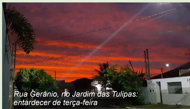
Rua Gerânio, no Jardim das Tulipas: entardecer de terça-feira