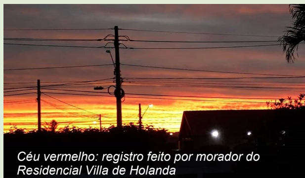
Céu vermelho: registro feito por morador do Residencial Villa de Holanda

do sol, eles precisam percorrer uma distância maior pela atmosfera. Nas situações em que os raios solares chegam mais inclinados, encontrando pelo caminho partículas de poluição e nuvens, ocorre a refração da luz (a refração é o fenômeno que faz com que a luz, ao atravessar alguma superfície, saia como um arco-íris do outro lado). O fenômeno aconteceu durante esta semana, mas vale a pena continuar olhando para o céu!