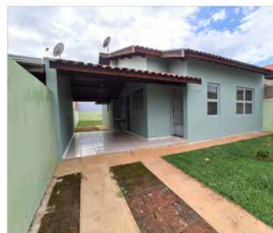
- GROOT - Cod. 448