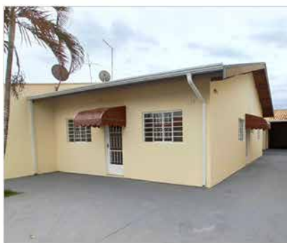
- JD DAS TULIPAS - Cod. 588