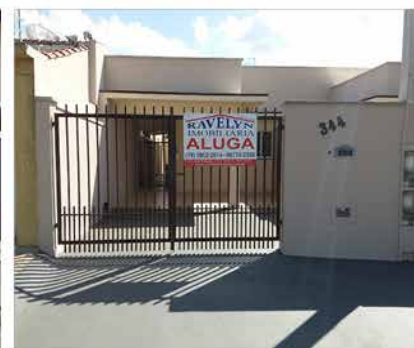
- JD DAS TULIPAS - Cod. 456