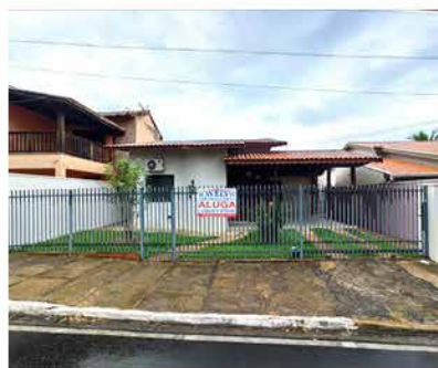
- MORADA DAS FLORES - Cod. 597