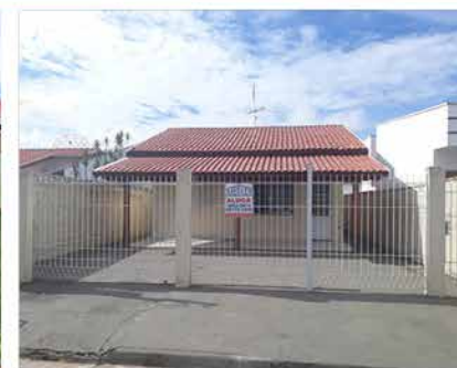
- JD DAS TULIPAS - Cod. 396