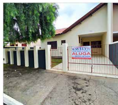
- GROOT - Cod. 578