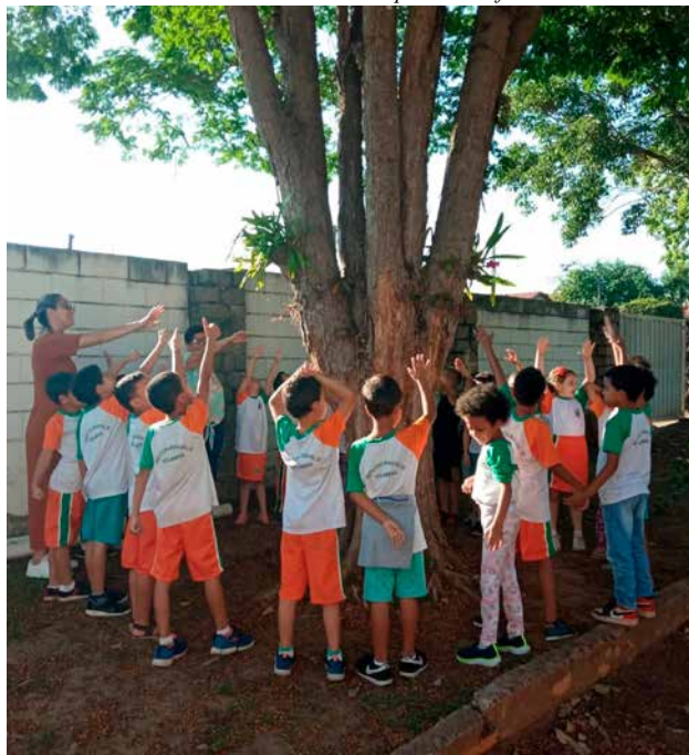
Assessoria de Imprensa Prefeitura de Holambra