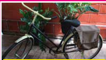
BICICLETA HOLANDESA RETRÔ (1953) RECÉM RESTAURADA TODA ORIGINAL. CHEGADA AO BRASIL: 1958 R$ 1.200,00