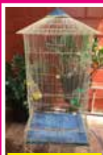
VIVEIRO PARA CALOPSITAS R$ 200,00