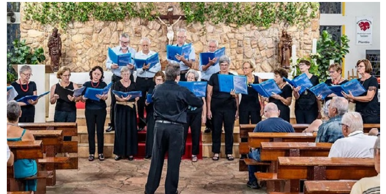
Coral Harmonia em apresentação na Matriz: grupo estará no Encontro

Acontece na próxima quarta-feira, dia 11, o Encontro de Corais do Clube Fazenda Ribeirão. Com início programado para às 19h, o evento contará com a presença de seis grupos de Holambra e região – os corais Harmonia, Pró Música, da Escola Waldorf Acalanto, da Terceira Idade, o COCA, de Campinas, e o coral do Colégio Objetivo, de Mogi Mirim. A noite faz parte da progra-