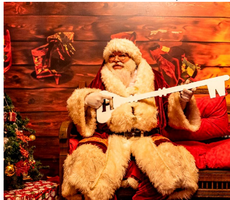
Na edição de 2023: Papai Noel com a "chave" da cidade

Decoração natalina - Locais como o Deck do Amor, a Praça dos Coqueiros e a Torre do Relógio receberão diversas peças decorativas. O portal principal contará com uma árvore de Natal de 15 metros de altura e, este ano, o entorno da Lagoa e a Praça da Nossa Prainha também receberão iluminação especial. A decoração da cidade vai contar ainda com mais de 140 quilômetros de cordões