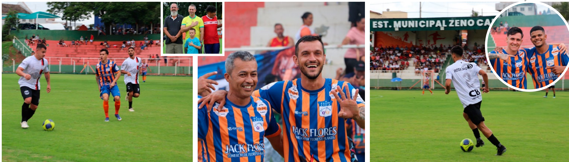
Imagens registradas na final do Campeonato de Futebol Amador 2024: partida foi muito disputada, cheia de emoções e comemoração