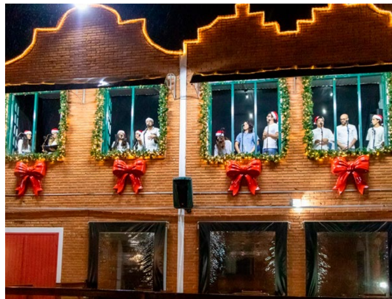
Cantata de Natal: atração no recinto da Expoflora

Além da festividade natalina desenvolvida pela Prefeitura, a cidade terá o Natal de Holambra – evento promovido pela iniciativa privada no Parque da Expoflora entre 22 de novembro e 22 de dezembro. Somadas, as iniciativas devem transformar a Capital Nacional das Flores em um