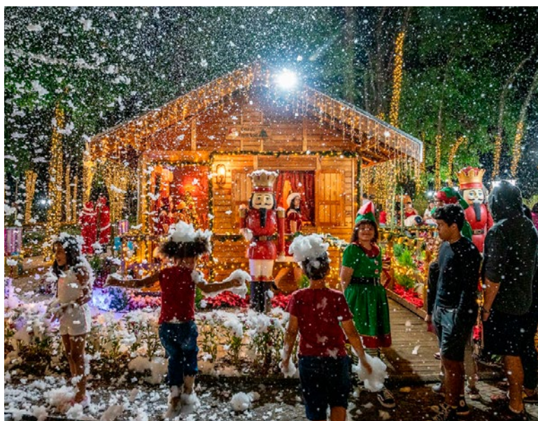
Magia do Natal: crianças brincam com a "neve" na Praça do Pioneiro

Mobilização em toda cidade - Entre o fim de novembro e o mês de dezembro estão programadas diversas ações por toda a cidade. O comércio contará com iluminação e decoração especial, com diversos cenários "instagramáveis" e muitos restaurantes comercializarão pratos típicos especiais para celebrar a data.