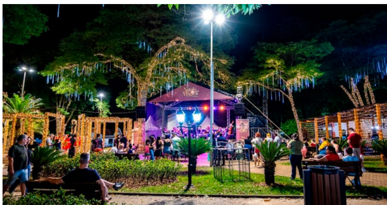
Parada natalina e apresentação musical na Praça dos Pioneiros: atrações do evento

segunda edição do Natal de Holambra – evento promovido pela iniciativa privada no Parque da Expoflora. Moradores da cidade, mediante apresentação do Cartão Cidadão válido e emitido até 31 de outubro, têm direito a