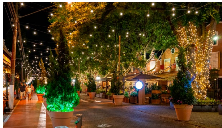
Rua Dória Vasconcelos, toda decorada para o Natal