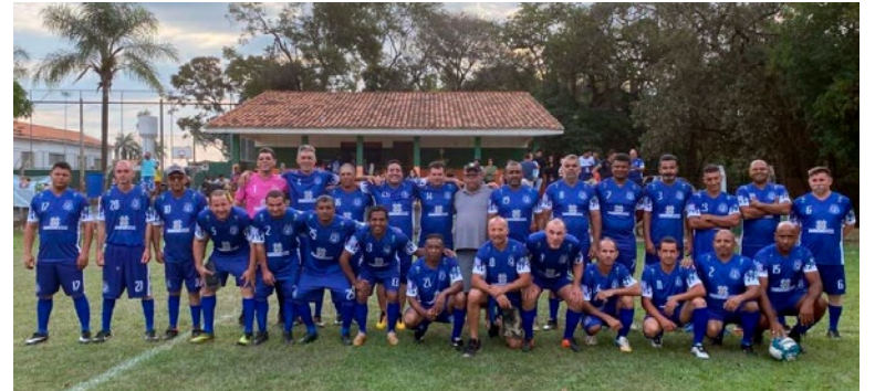
Juventude Anos 90: disputa com Veteranos de Holambra neste sábado

Neste sábado, dia 14, às 14h30, os times Juventude Anos 90 e Veteranos de Holambra se enfrentarão em um jogo de futebol beneficente no Campo Municipal "José Maria de Lima", no Fundão.