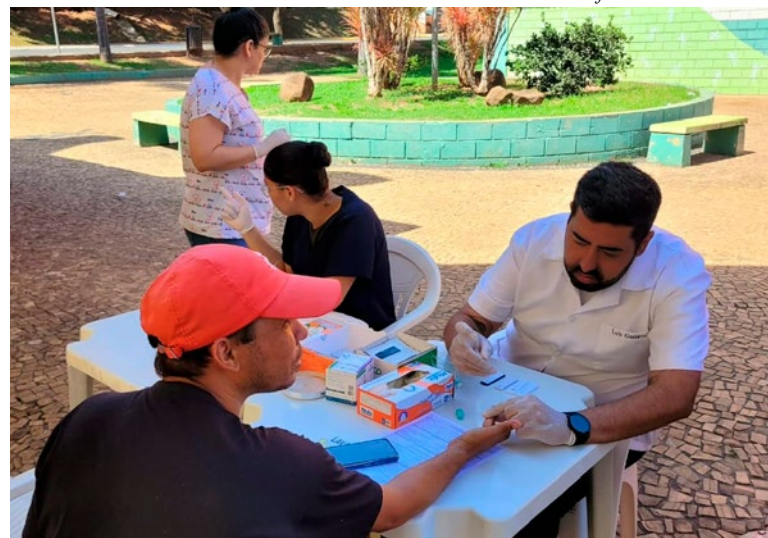
Ação na Rua da Amizade: orientações e testagem para maiores de 18 anos

Os sintomas de cada infecção podem variar, mas segundo a médica, os primeiros