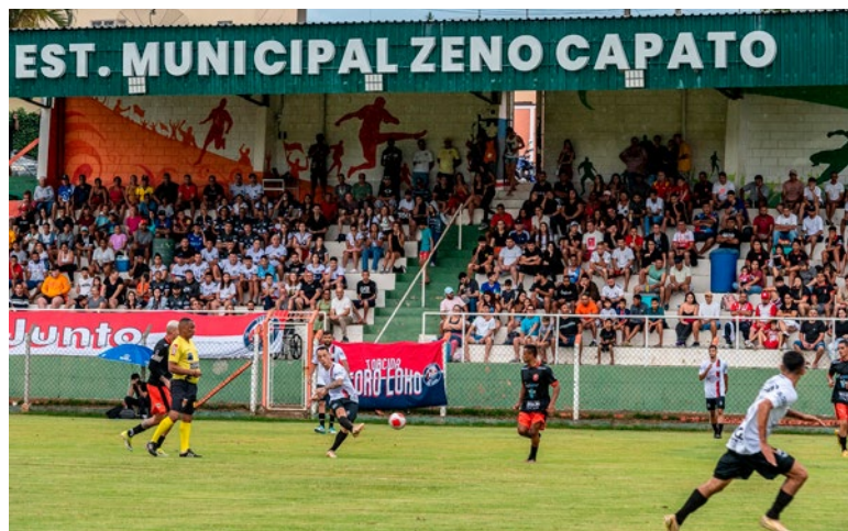
Estádio Municipal: reformado, equipamento está apto a sediar jogos da Federação Paulista e da CBF