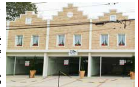
LOCAÇÃO SALA COMERCIAL Rua Campo de Pouso - c/ 85m²

ARTUR NOGUEIRA - JD CONSERVANI • CASA: c/ 02 dorms (01 st), sala dois ambientes, cozinha, banheiro social, lavanderia, área externa c/ churrasqueira, quintal amplo e garagem coberta com portão automático. Imóvel c/ documentação - Aceita financiamento