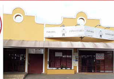
- MORADA DAS FLORES - Cod. 461