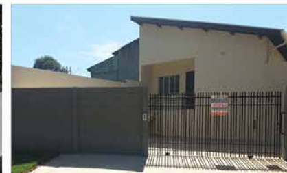
- IMIGRANTES - Cod. 453

CHÁCARA CAMANDUCAIA - 1100m 2 com casa de 02 dormitórios, sendo 01 suite, sala/cozinha, churrasqueira com banheiro, quintal bem arborizado