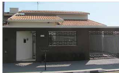
- JD DAS TULIPAS - Cod. 527