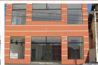
- MORADA DAS FLORES - Cod. 550

- CENTRO (374/543): Salas comerciais de 50m até 200m - ideal para escritórios ou loja