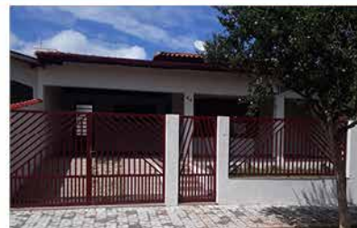
- JD DAS TULIPAS - Cod. 457