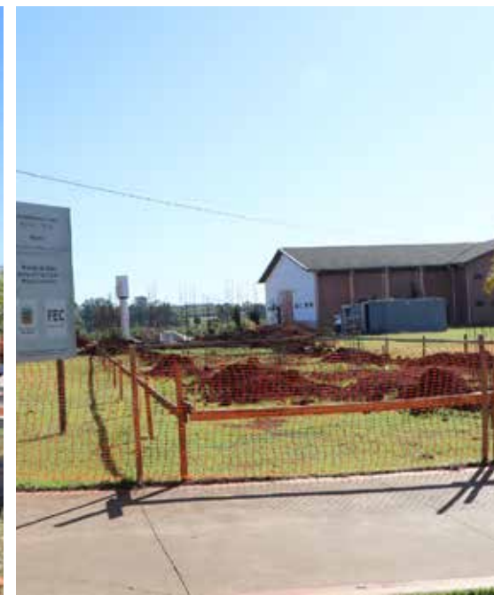
Segunda licitação: empresa vencedora terá um ano para entregar a obra

Cultura e Eventos. Suspensa desde o início da quarentena, esta feira será retomada a partir deste final de semana, dia 5 de setembro.