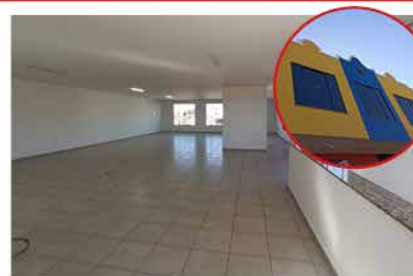
- MORADA DAS FLORES - Cod. 421