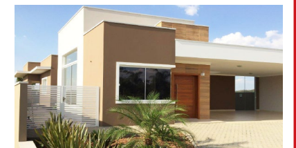
** OPORTUNIDADE ** VENDA - Residencial Flor D'Aldeia Casa térrea - 481 m² c/ 240 m² ac) 03 suítes, cozinha planejada, espaço gourmet completo ACEITA FINANCIAMENTO + Detalhes no site - Cód CR606