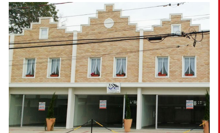
LOCAÇÃO - Sala Comercial (c/ 85m²) + Detalhes no site: Cód S309