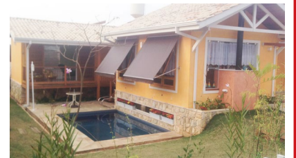
CASA A VENDA - FLOR D'ALDEIA. Parte externa (divisa com Jd das Tulipas) + Detalhes no site: Cód CR608

02 dormitórios, 02 banheiros, churrasqueira, fogão e forno à lenha, árvores frutíferas, portão automático.