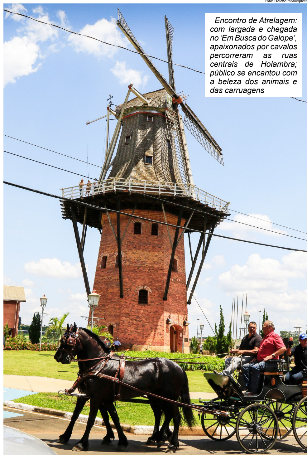
Encontro de Atragem: com largada e chegada no 'Em Busca do Galope', apaixonados por cavalos percorreram as ruas centrais de Holambra; público se encantou com a beleza dos animais e das carruagens

O rali de Regularidade será no sábado; domingo foi reservado para o rali de Velocidade. Na cidade, segundo informações dos organizadores, alguns trechos ficarão interditados em horários diferentes, mas os moradores contarão com o apoio de comissários de pista e segurança – além do policiamento local – para qualquer imprevisto e para obter orientações sobre o evento.