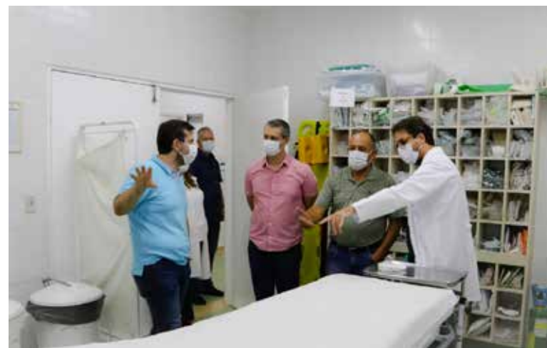
Academia de Saúde, voltada ao atendimento de fisioterapia

pe forte, dedicada. E estamos fazendo os investimentos necessários para garantir toda a retaguarda necessária de insumos para tratamento e para internações em leitos locais. Intimamente, comemoramos a cura de pacientes, a chegada de novas doses de vacina, qualquer novidade positiva. Por outro lado, lamentamos o aumento de casos e as vidas que são perdidas. Vidas de gente que conhecemos, com quem convivemos. Sou muito grato pelo empenho desse incrível grupo de profissionais da saúde de Holambra, que vivenciam essas vitórias e derrotas na linha de frente,