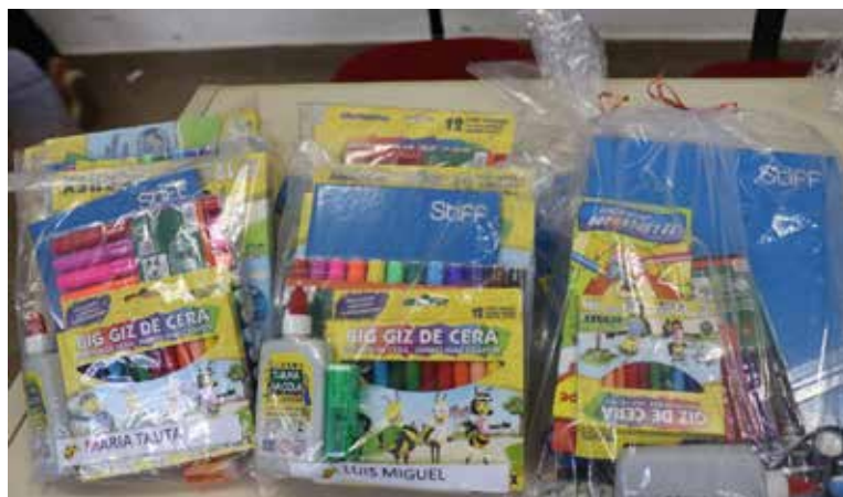
Mais de 2300 kits escolares distribuídos para alunos da rede municipal

a confiança demonstrados pelas pessoas todos os dias, nas ruas ou nas redes sociais. É uma relação que nos fortalece e nos enche de otimismo. Assumir o mandato em meio a uma situação de crise social e econômica causada por uma pandemia tão agressiva é, por si só, marcante. Mas prefiro destacar os sentimentos de esperança, solidariedade e perseverança que vivencio quase que diariamente no contato com cidadãos e servidores municipais. A empatia que vejo nas pessoas, mesmo num momento tão difícil para todos.