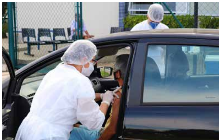
1746 doses de vacina contra Covid-19 aplicadas