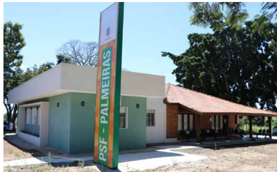
Reforma e ampliação do PSF Palmeiras

blemas significativos nestas áreas. Nossa Polícia Municipal tem colaborado muito nas barreiras sanitárias de orientação e em ações para evitar aglomerações. Com relação ao transporte, tivemos apenas restrições pontuais decorrentes das determinações do Plano São Paulo e da falta de demanda pelos ônibus circulares aos domingos.