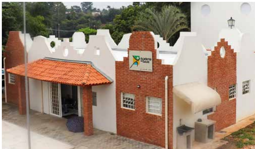
Readequação da Policlínica, triplicando o número de leitos de observação de Covid, com aparelhagem adequada