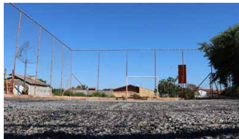
Implantação de grama sintética na quadra do Imigrantes