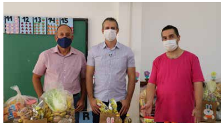
Mais de 4600 kits de alimentação não perecíveis, ovos, frango desossado, frutas, verduras e legumes