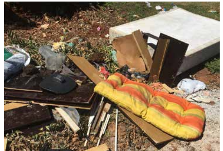
Descarte irregular Rua Scholten esquina Rua Schoenmaker, no bairro Imigrantes

do Cata-Bagulho em cada bairro, antes das 7h30. É importante que cada um faça a sua parte, evitando o acúmulo