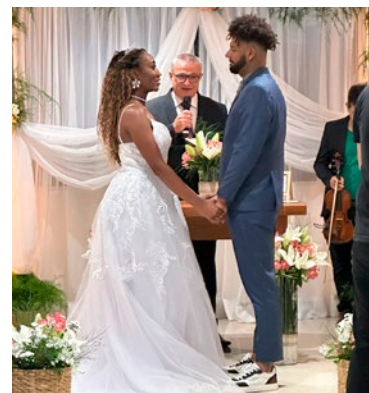
Simulação de Cerimônia de Casamento, realizada pela Sonho das Noivas, na capela do 3 Tamancos