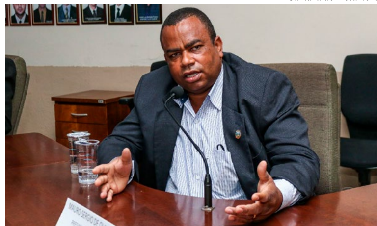
AI Câmara de Holambra

Participação popular - Além disso, o vereador reforça a importância de uma gestão transparente e de maior participação popular. Durante a presidência, ele implementou o sistema de transmissões online para que a população pudesse acompanhar as sessões da Câmara. "Muitas vezes as pessoas estão ocupadas e cansadas após o trabalho, então buscamos oferecer um formato acessível para que acompanhem as discussões", explica. No entanto, ele acredita que ainda não tem colhi-