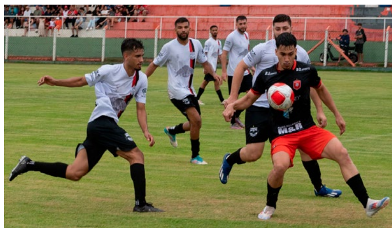
Nas fotos, lances da partida entre Imigrantes e Tamo Junto