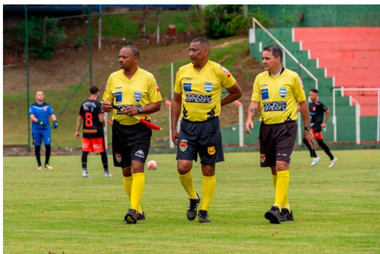
Trio de arbitragem na semifinal

duas equipes estão incentivando os torcedores a participarem da final solidária, levando como doação 1 kg de alimento não perecível ou um produto de higiene.