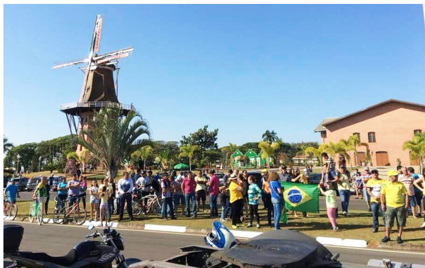
Moinho Povos Unidos contracena com a população holambrense durante a manifestação de apoio à Greve dos Caminhoneiros, na manhã ensolarada do último dia 27.