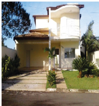
COND. NOVA HOLANDA.