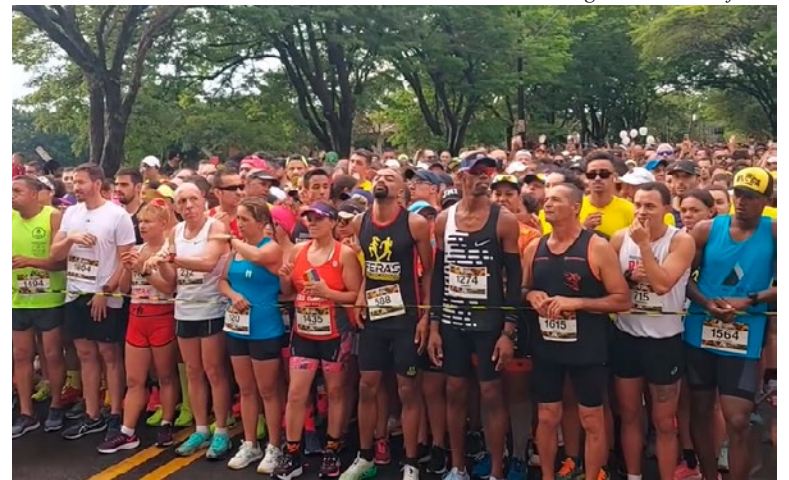
Participantes preparados para a largada na edição de 2023 da corrida

Além da corrida principal, haverá uma caminhada recreativa de 4 km, onde os participantes poderão apreciar atrações como a Praça da Cachoeira, o Chafariz do Boulevard Holandês, o Monumento Memorial do Imigrante, o Deck do Amor e a Rua dos Guarda-chuvas.