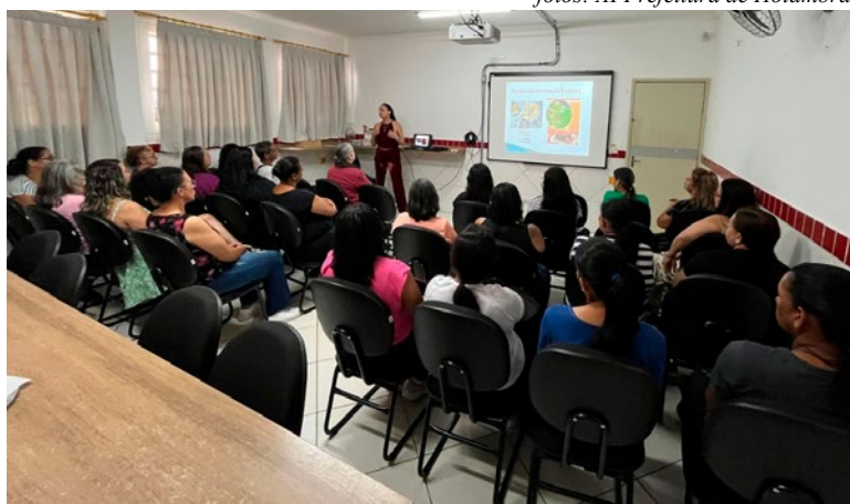
Merendeiras participam de curso de capacitação