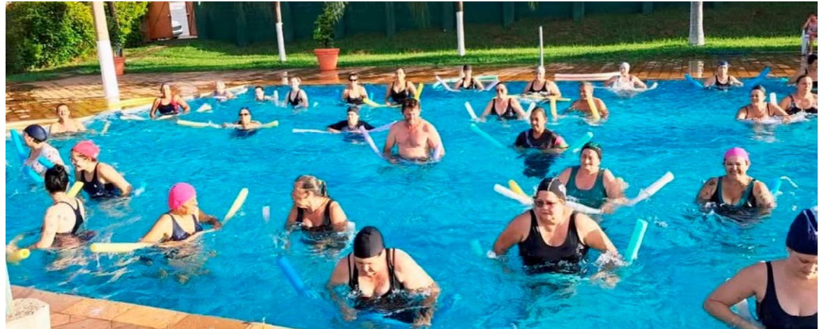
Al Prefeitura de Holambra

Podem participar das aulas de hidroginástica moradores a partir de 13 e até 85 anos. No caso da Natação, há opções para adultos e crianças a partir de 6 anos.