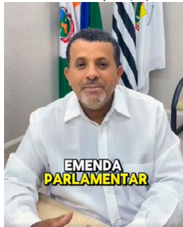
Em vídeo, vereador ressalta busca de recursos