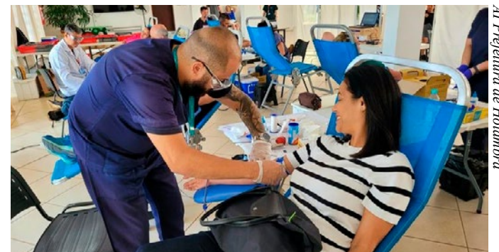
Al Prefeitura de Holambra

A primeira Campanha de Doação de Sangue do ano, promovida pela Prefeitura e o Hemocentro da Unicamp, acontece no próximo dia 7, das 8h às 12h, no Salão da Terceira Idade. Para doar é preciso apresentar um documento de identidade com foto, ter entre 18 e 69 anos de idade, pesar mais de 50kg e estar em boas condições de saúde. Os interessados passarão por entrevista.