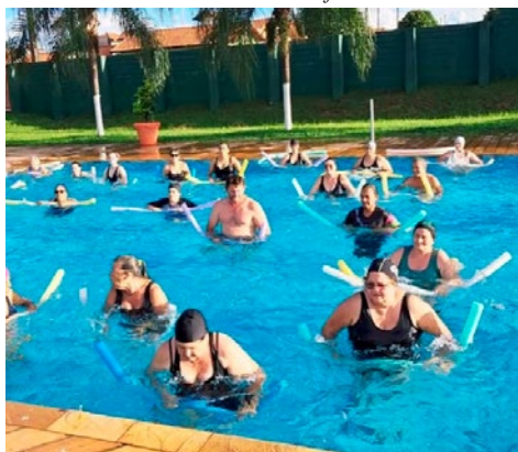
Al Prefeitura de Holambra